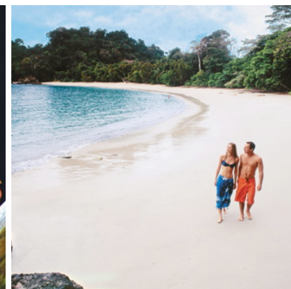
Parque Nacional Manuel Antonio