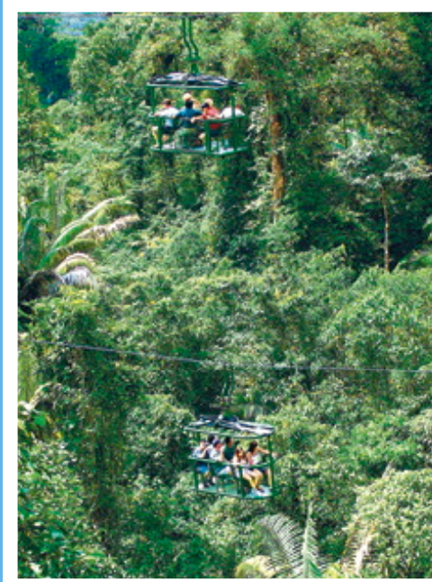
Parque Nacional Braulio Carrillo

Toda esta belleza escénica se complementa con un excelente menú de tours. Organizados para ofrecer una gran variedad de opciones a escoger, entre ellos: tours a caballo, contacto con la naturaleza, los canales de Tortuguero, visitas a piñales, plantas de flores tropicales, haciendas de azúcar o plantaciones de banano,