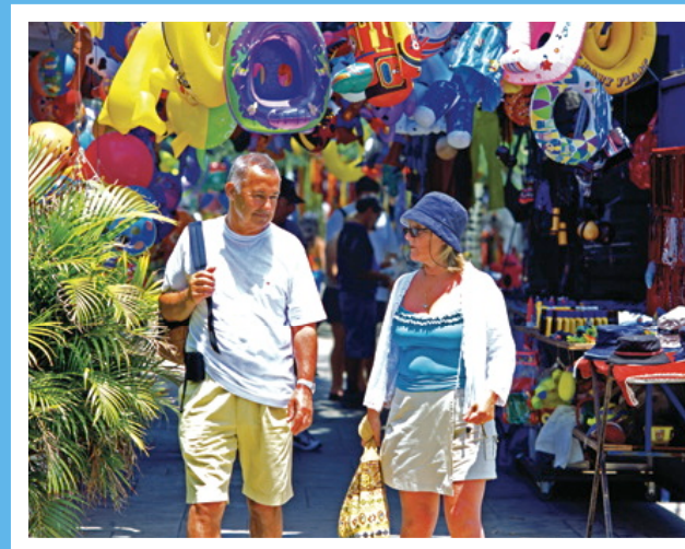
Paseo de los Turistas

La riqueza del Pacífico Central se puede disfrutar al realizar un paseo a caballo, la observación de lagartos, recorridos en los teleféricos, rafting o caminatas en las copas de los árboles en varias zonas cercanas.