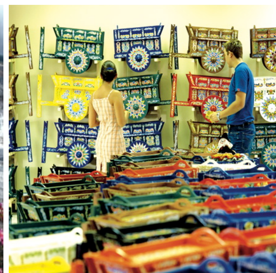
Tienda de Artesanías, Sarchí