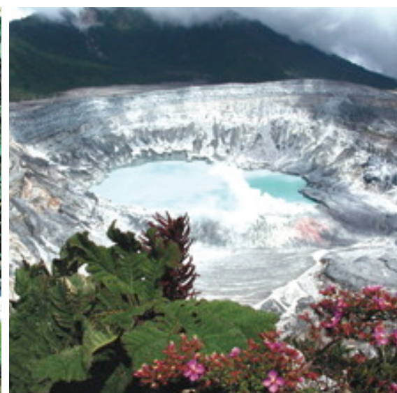
Parque Nacional Volcán Poás