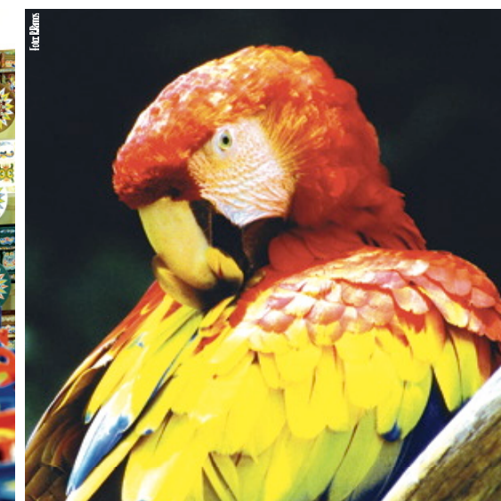
Lapa en Parque Nacional Carara