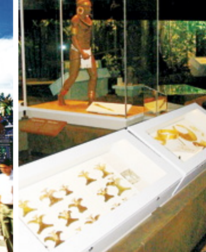
Museo de Oro