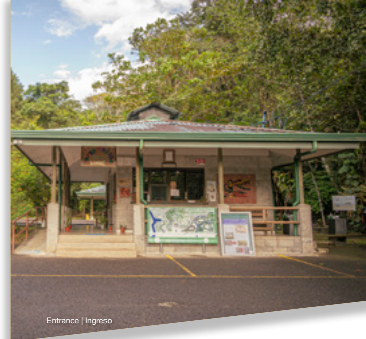
Entrance | Ingreso